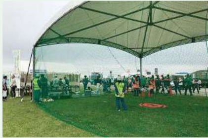
ドローン操作体験会場