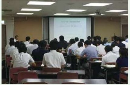
道路計画設計研修 (主催：(公財)千葉県建設技術センター) 2018年8月31日

長年にわたり培ってきた技術力の成果を活かすため各種技術研修会に、県コンから講師を派遣し、多方面の土木技術の向上に努めています。