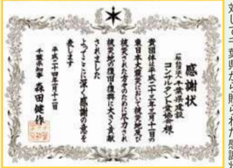
東日本大震災の災害復旧に迅速に対応した協定が、被災者や被災地の救済に大きく貢献した。