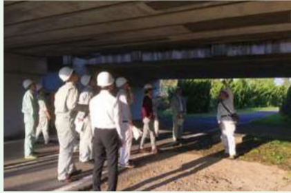
橋梁点検研修 (主催：千葉県県土整備部技術管理課) 2018年11月8日