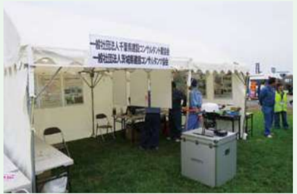
水防演習パネル展示ブース

平成30年5月栄町で開催された第67回利根川水系連合・総合水防演習に県コンの被災時の活動などを紹介するパネル展示を行いました。また、一般社団法人茨城県建設コンサルタント協会と共同でドローン操縦を体験できる場を提供しました。