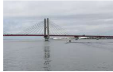
C-1. 銚子大橋 (銚子市)